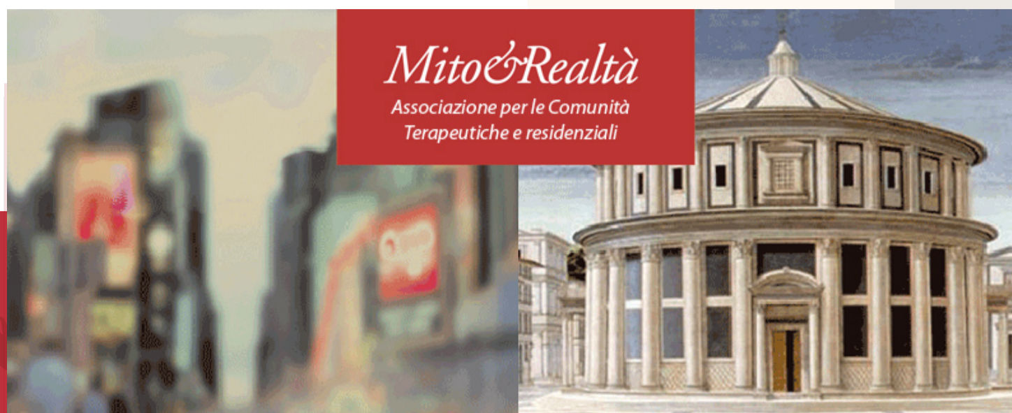
Tavola Rotonda: "Mondo interno, mondo esterno: la psicoterapia individuale nelle comunità terapeutiche"

Passaggi Comunità Terapeutico-Riabilitativa